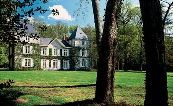
HET LANDHUIS WERD IN 1911 GEBOUWD DOOR EEN FRANSE GENERAAL.

IN EN ROND CHAMP ROCHER Wie bij Karel een verblijf boekt, is in de eerste plaats op zoek naar rust en kalme. Het domein ligt vrij afgelegen en zonder wagen kan je er niet veel aanvangen. Vooral de natuurliehebber komt hier uitgebreid aan zijn trekken. 's Ochtends zie je herten, eekhoorns of dassen tussen het groen. Er zijn fliessen ter beschikking en je kan paardrijden op het domein zelf. »Poitiers: historische stad op 75 km van Champ Rocher. » Chauvigny en Angles-sur-Anglin zijn aangename middeleeuwse stadjes met onder meer ruïnes van middeleeuwse kastelen en pittoreske steegjes. » Het kasteel van Azay le Ferron (15 km verderop): beremeubeld kasteel in Loire-stijl met prachtige tuinen. Pas opnieuw geopend in mei van dit jaar. » Het mooie Maison du Parc in Rosnay zet je graag op weg om de rijke natuur van de Brenne te ontdekken. (tel 00 33 (0) 254 28 12 13 of www.parc-naturel-brenne.fr). » Eten en drinken: het gebied heeft slechts één wijnjaard (15 ha) die een smakelijke Loire-wijn biedt, domaine de Kis in Bossay-sur-Claise. De rode Seigneur Clément is een aanrader. Te koop op het domein zelf. Tel 00 33/247 94 64 43, e-mail: domaine-de-ris@vanado.fr. De Pouilly-Saint-Pierre is geen getienka die het etiket AOC mag dragen. De korst is dun en blauwig. Bijzonder smakelijk van april tot oktober. Wij bezochten de kaasmakerij van de Nederlanders Anneke Baas en Frans Haalbeos. La Callonnère. 36240 Paulnay. tel 00 33 (0) 254 38 07 96, e-mail: haalbaas@libertysurf.fr.