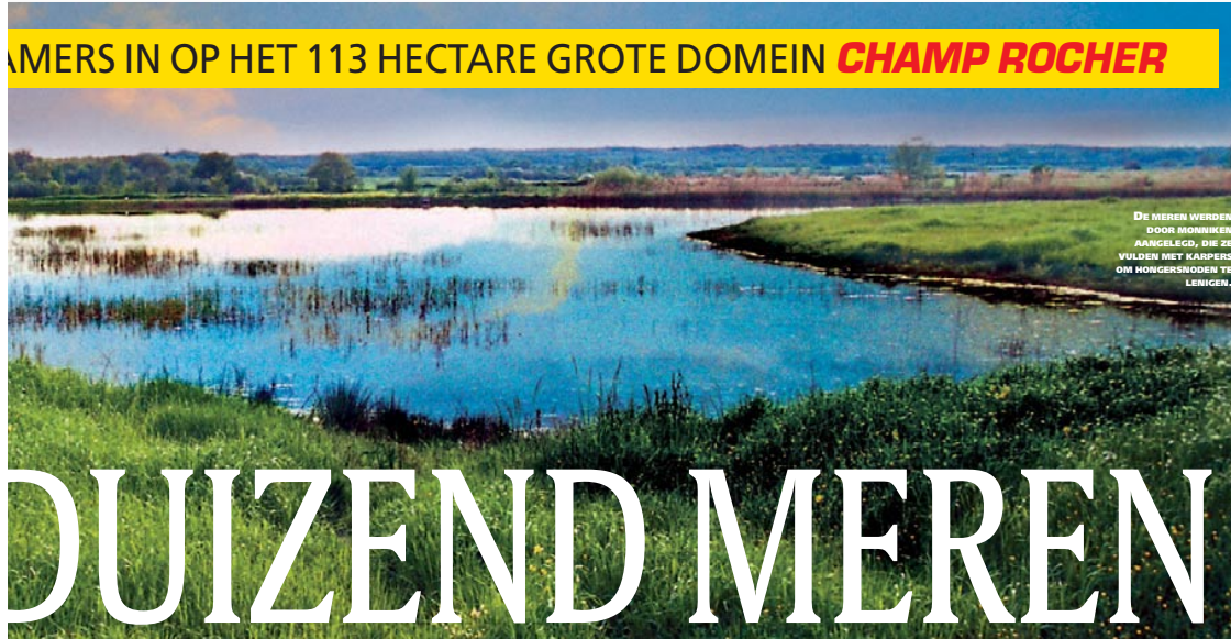
DE MEREN WERDEN AANGELEGD, DIE ZE WILDEN MET KARPERS OM HONGERSNODEN TE LEMIGEN.